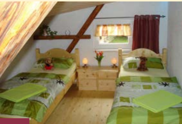
1. OG Kinderzimmer

Es erwartet Sie ein großzügiges Grundstück mit altem Baumbestand, viel Grün, in einer absolut ruhiger Lage. Zudem stellt es einen optimalen Ausgangspunkt für die Erkundung der sächsischen Highlights dar. Ein sehr gutes Lokal mit Biergarten und Bowlingbahn befindet sich in unmittelbarer Nähe (Frühstück kann dort täglich zugebucht werden)